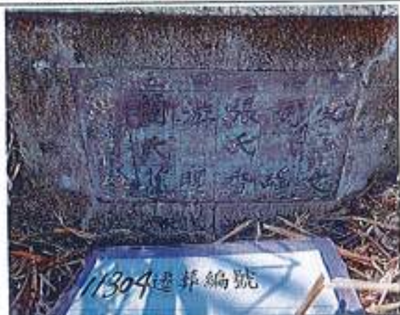
2、受葬姓名牌相片:6人