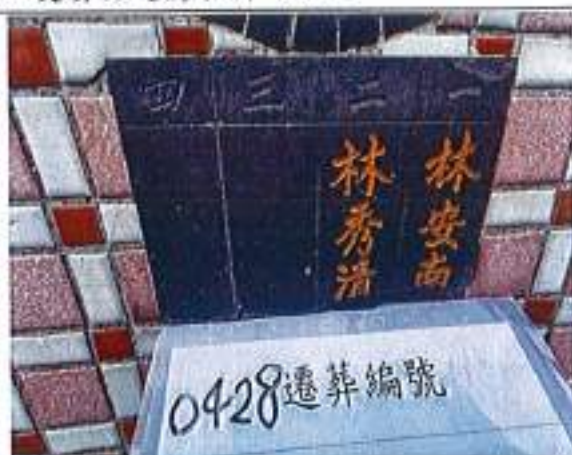
2、受葬姓名牌相片：2人